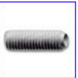
DIN913, DIN914, DIN915, DIN916 – стопорен винт с вътрешен шестостен