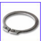
DIN471 – зегерка за вал