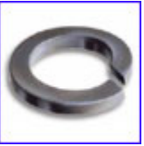
DIN127 – шайба пружинна