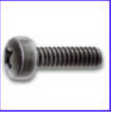
DIN7985 – винт с цилиндрична глава и кръстат шлиц