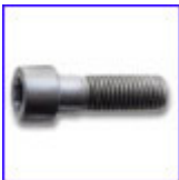
DIN912 - винт с цилиндрична глава и вътрешен шестостен, якост 8.8, 12.9