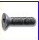
DIN7991 – винт с фрезенкова глава и вътрешен шестостен, якост 12.9