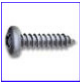
DIN7981 – самонарезен винт с обла глава и кръстат шлиц