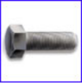
DIN933 - болт с шестостенна глава, цяла резба, якост 8.8, 10.9