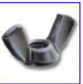
DIN315 – крилчата гайка