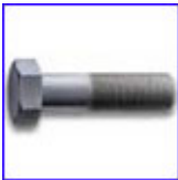
DIN931 - болт с шестостенна глава, частична резба, якост 8.8, 10.9