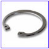
DIN472 – зегерка за овор