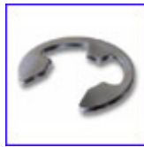
DIN6799 – зегерка за вал