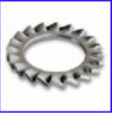
DIN6798 – шайба назъбена