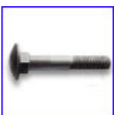
DIN603 – коларски болт