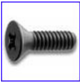
DIN965 – винт за метал с фрезенкова глава и кръстат шлиц