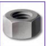
DIN934 – гайка шестостенна, якост 8, 10