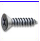
DIN7982 – самонарезен винт с фрезенкова глава и кръстат шлиц