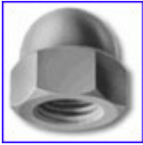
DIN1587 – гайка шестостенна глуха