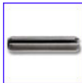
DIN1481 – щифт пружинен