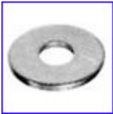
DIN9021 – шайба с широка периферия