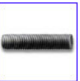
DIN975 – шпилка