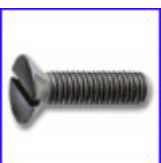
DIN963 – винт за метал с фрезенкова глава и прав шлиц