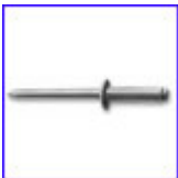
DIN7337 – поп нит