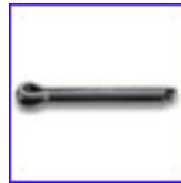
DIN94 – шплент