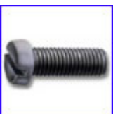
DIN84 – винт за метал с цилиндрична глава и прав шлиц