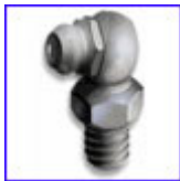
ГРЕСЬОРКИ – прави, 90 градуса, 45 градуса