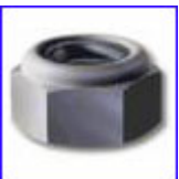
DIN985 – гайка шестостенна осигурителна