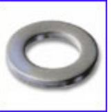
DIN125 – шайба